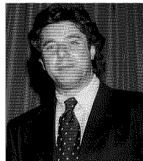
Calabrese biochimico a Catania

RICERCA La carnitina riduce lo stress ossidativo della cellula e la protegge dai danni delle radiazioni